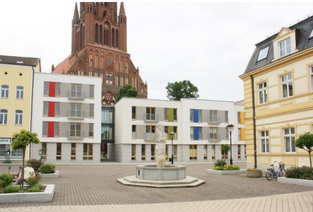
Wohn- und Servicehaus am Markt