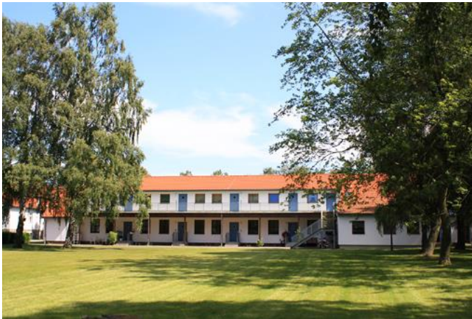
Außenansicht Haus Emmaus